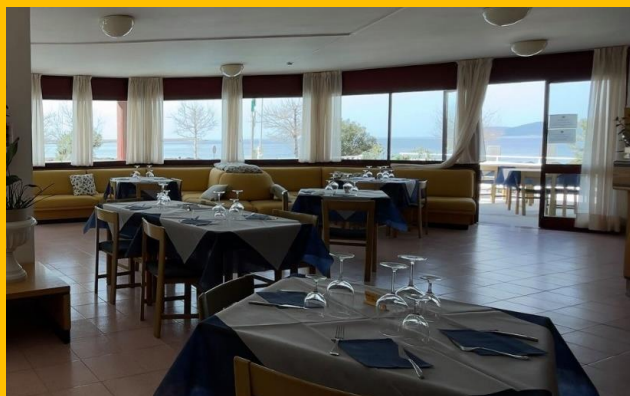
Ristorante Dietro il Carcere

Vino bianco e rosso – Cantina Grappolo D'oro Acqua e bevande analcoliche Caffè e digestivo